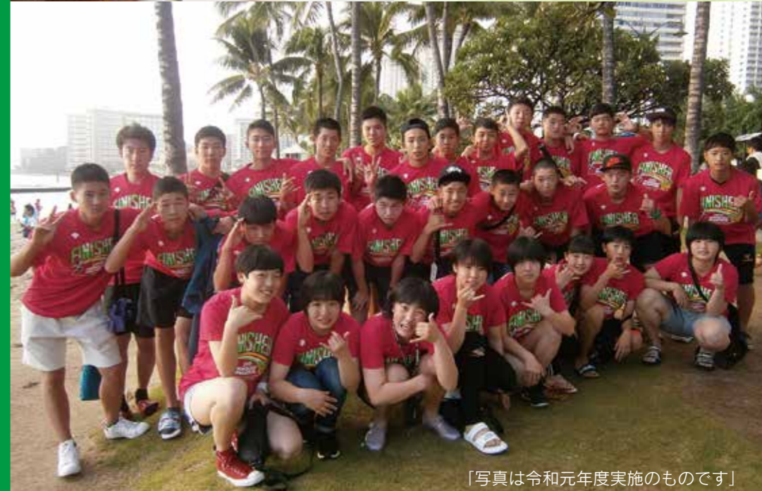
「写真は令和元年度実施のもので」